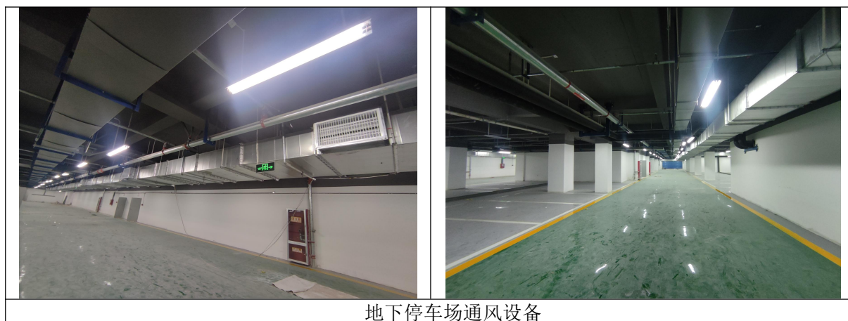
地下停车场通风设备

本项目地下车库位于地下 2 层，建筑面积 11616.1m 2 ，地下车位为 706 个。地下车库换气系统风机 3 台，风井 3 个，排气筒 23 个，排气口位于厂区绿化带内。地下车库换气次数约 6~8 次/h，车库汽车尾气分别经送风、排风系统从通风井进气、排放，排出后经空气稀释扩散，通风情况见图 4.1-3。