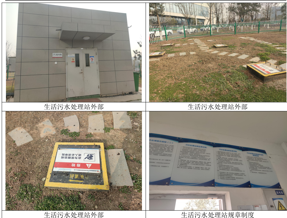
生活污水处理站外部